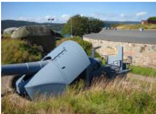
Moses, Josua eller Aron?