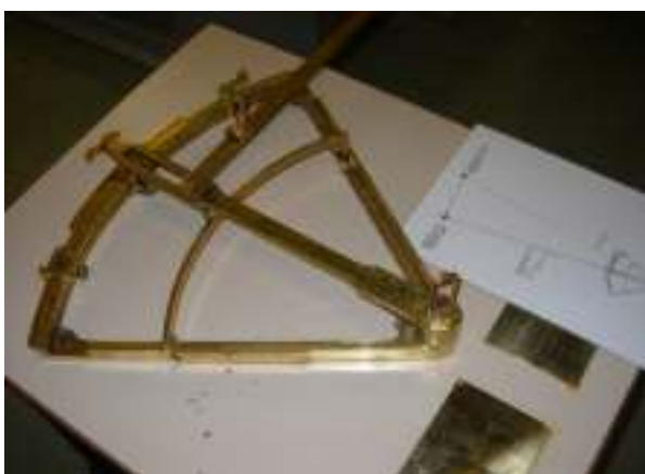
Sigteinstrument til beregning af målets hastighed og torpedoenes affyringspunkt.