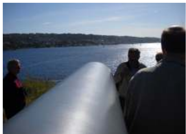
Herfra vogtes indsejlingen til Oslo.