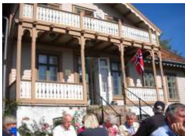
Kaffe i Kommandantgårdens have.