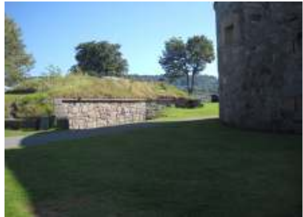
Fæstningens omgivelser spænder fra klippede plæner til græsklædte bunkers og fjeld.