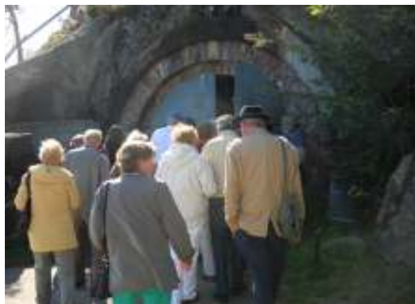
På vej ind i torpedostationen.