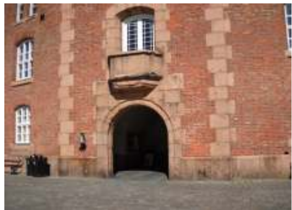
Fra fæstningsgården. Murværket er koppearret efter angrebet 9. april 1940.