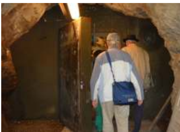
Vi skal passere en del solide døre.