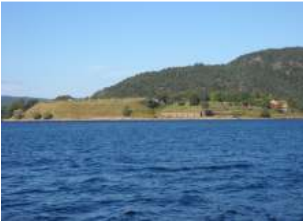
Oscarsborg – vi er på vej med færgen fra Drøbak.