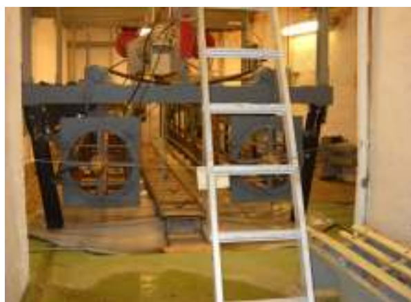
Torpedobørst. Åbningen var overdækket for at undgå kondens.