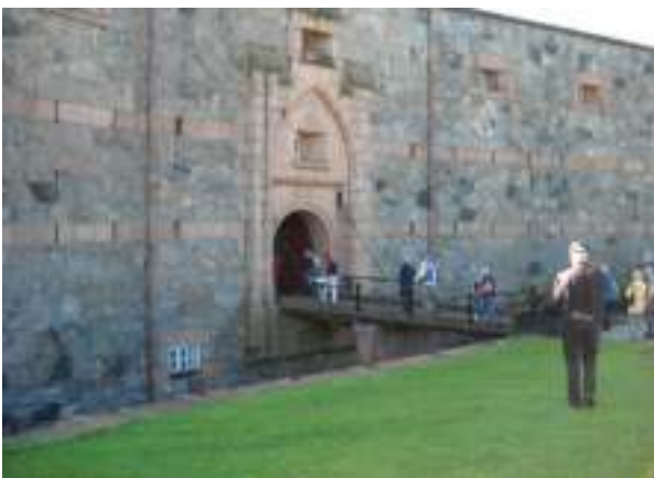
Går vi ind i en ridderborg?