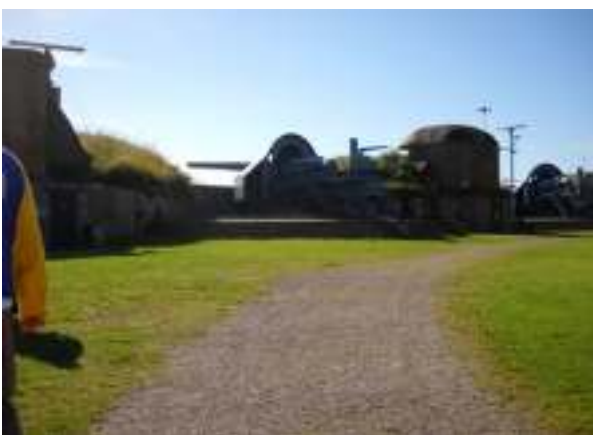
Hovedbatteriet med 3 stk. 28 cm kanoner.